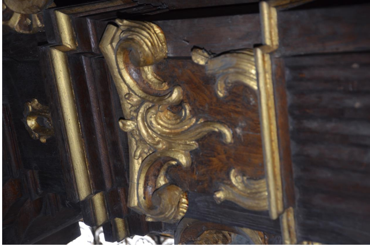
Hlavice sloupu je provedena technikou zlacení a fládrování