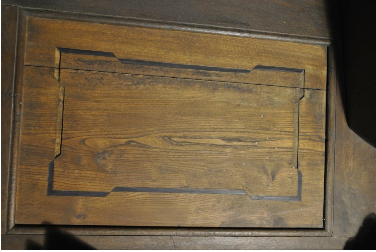
Rozeschlá výplň s chybějícím páskovým dekorem