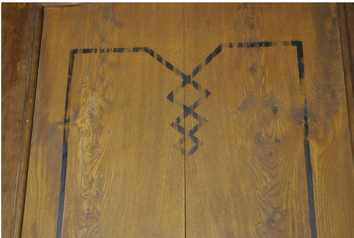
Rozeschlá středová výplň nad sedákem s domalovaným pásovým ornamentem